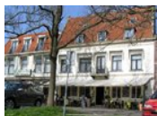
Hotel Restaurant Die Port van Cleve *** (Enkhuizen) www.deportvancleve.nl