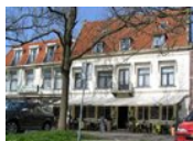
Hotel Restaurant Die Port van Cleve *** (Enkhuizen) www.deportvancleve.nl