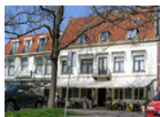
Hotel Restaurant Die Port van Cleve *** (Enkhuizen) www.deportvancleve.nl