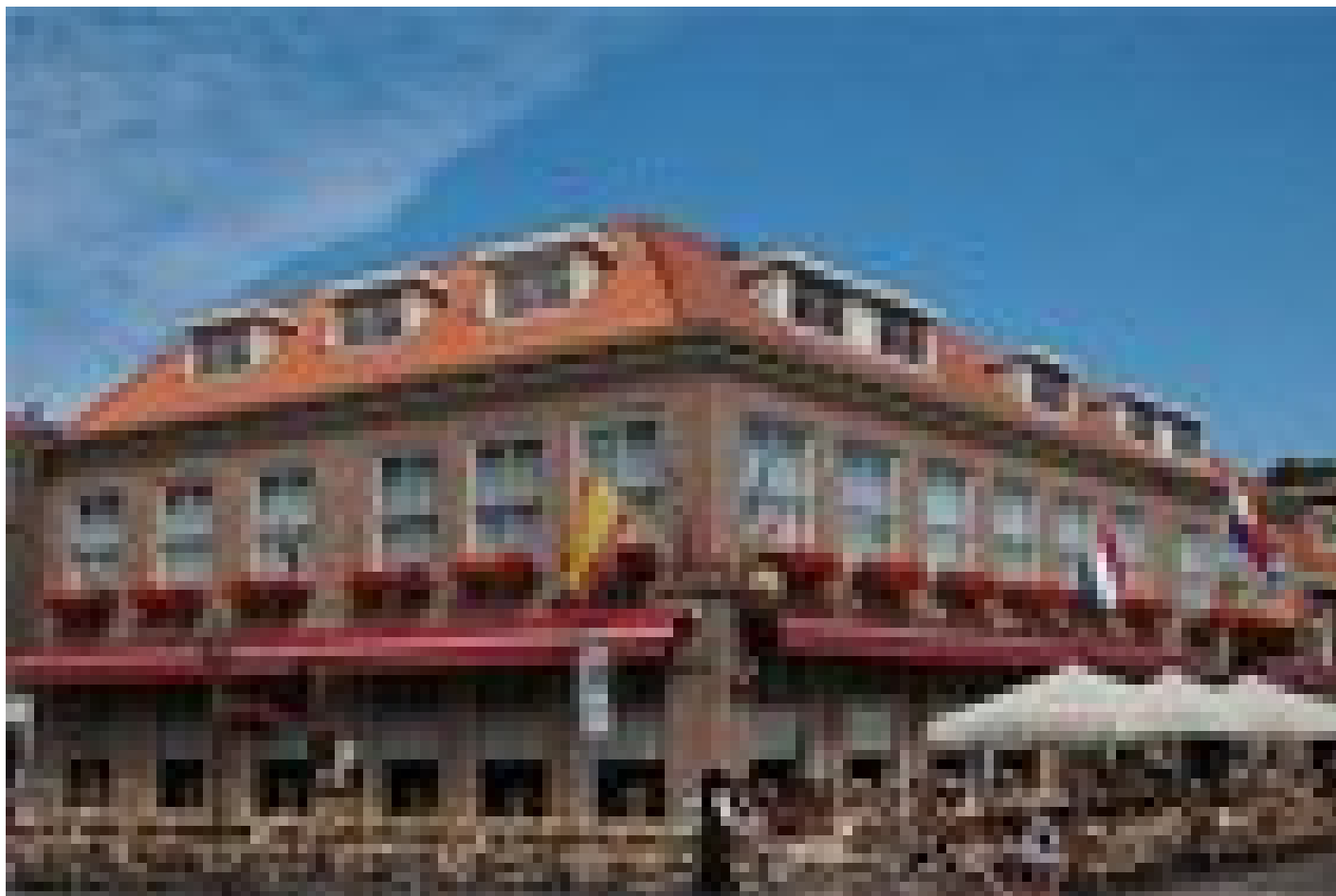
Hotel de Keizerskroon *** (Hoorn)