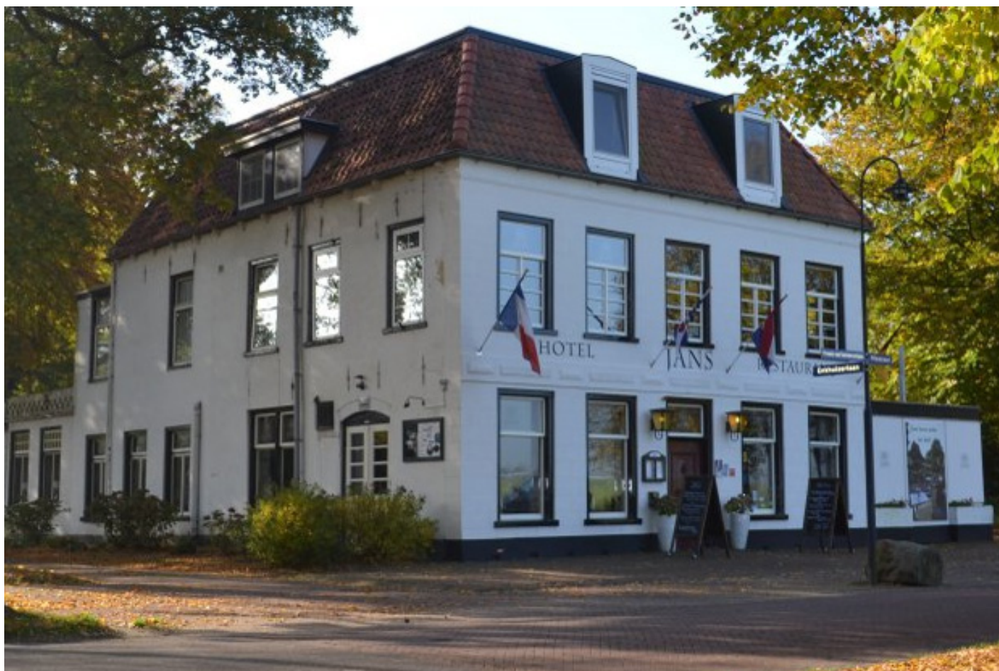
Hotel Jans*** (Rijs)