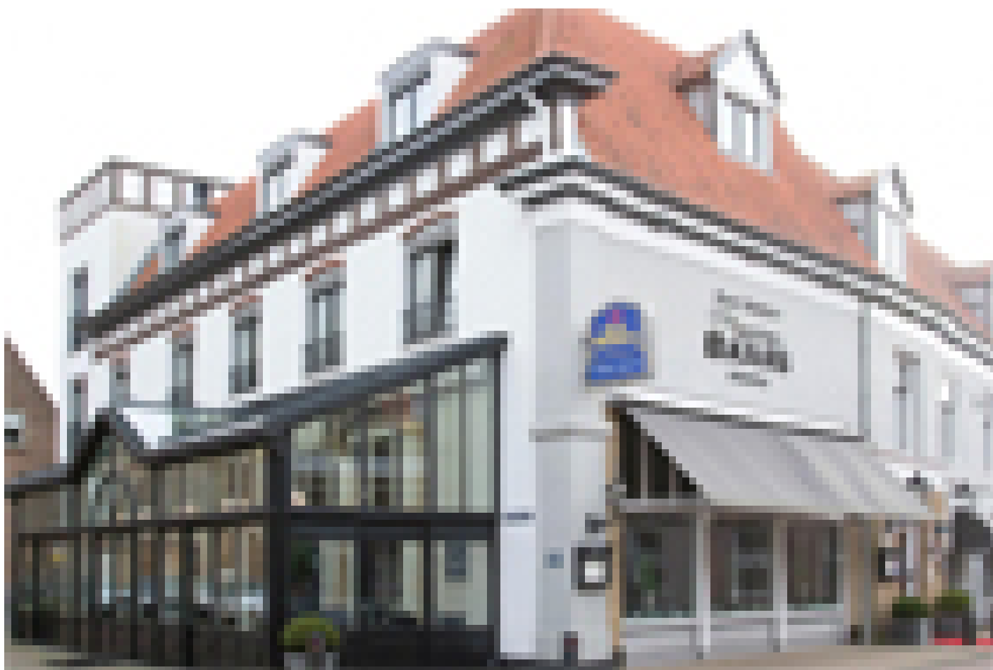
Best Western Hotel Baars **** (Harderwijk)