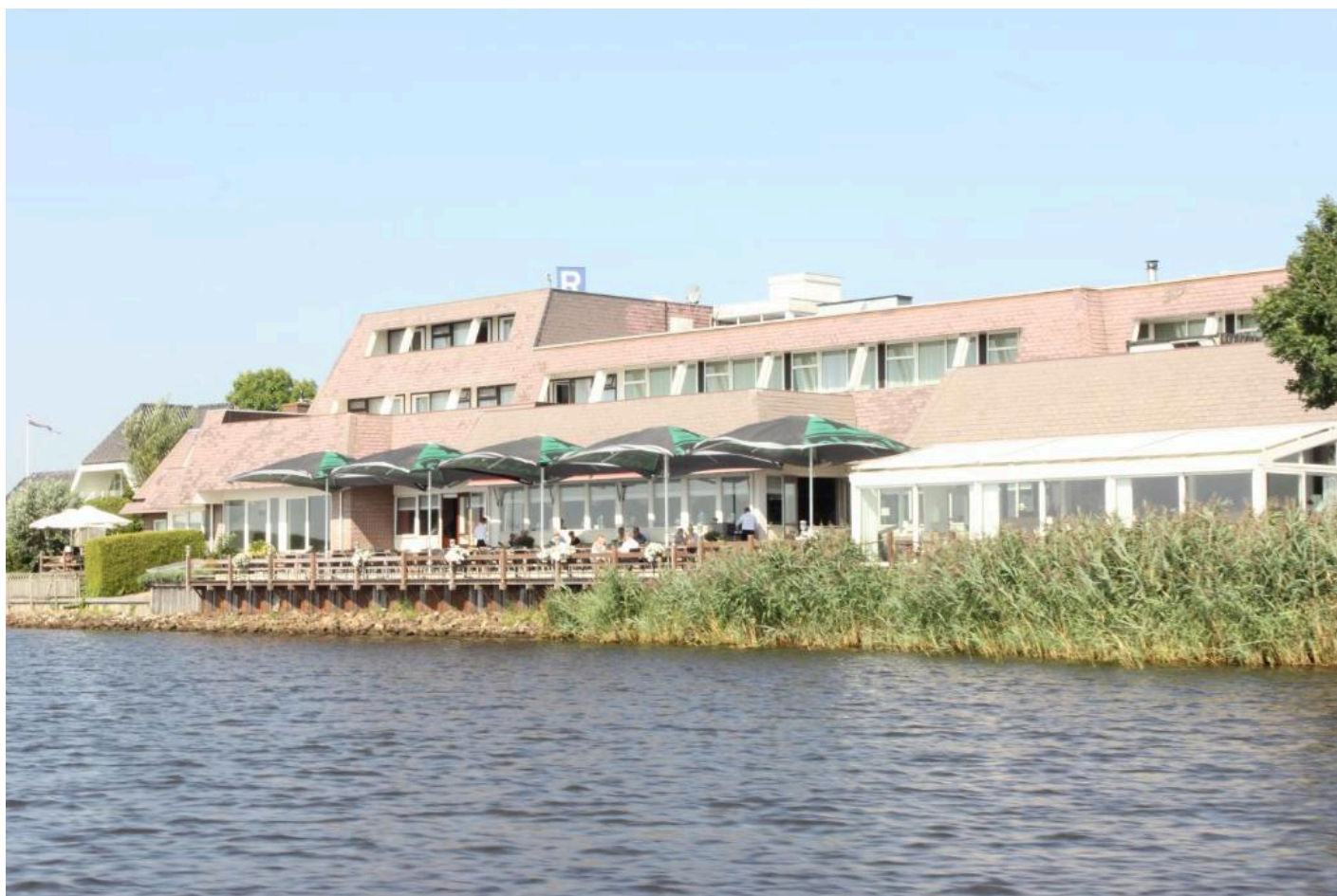
Hotel Zwartewater **** (Zwartsluis)