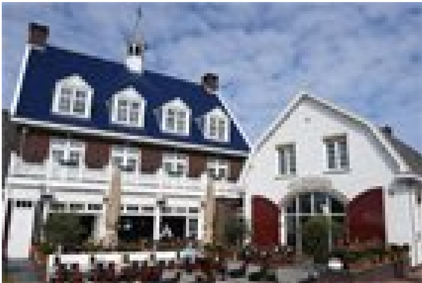
Fletcher Hotel Nautisch Kwartier **** (Huizen)

Lors de la sélection de l'hébergement, nous essayons de tenir compte autant que possible d'un abri à vélos sûr et fermé. Cependant, nous ne pouvons pas le faire avec toutes les garanties et cela dépend en partie du nombre de bicyclettes des autres hôtes.