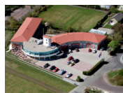
Fletcher Duinhotel Burgh Haamstede **** (Burgh Haamstede)

Les hôtels et chambres d'hôtes de ce voyage ont été soigneusement sélectionnés pour leur emplacement, leur atmosphère et/ou leurs services uniques. Toutes les chambres sont équipées d'une salle de bain. Une liste des hôtels avec lesquels nous travaillons figure ci-dessous. Si un certain hébergement ne peut être confirmé en raison d'un manque de disponibilité, nous demanderons une alternative comparable. Lors de la sélection de l'hébergement, nous essayons de tenir compte autant que possible d'un abri à vélos sûr et fermé. Cependant, nous ne pouvons pas le faire avec toutes les garanties et cela dépend en partie du nombre de bicyclettes des autres hôtes.