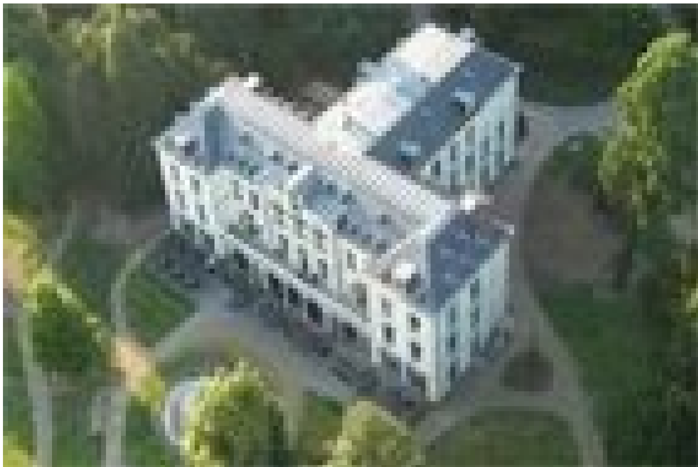
Hotel Villa Ruimzicht **** (Doetinchem)

Lors de la sélection de l'hébergement, nous essayons de tenir compte autant que possible d'un abri à vélos sûr et fermé. Cependant, nous ne pouvons pas le faire avec toutes les garanties et cela dépend en partie du nombre de bicyclettes des autres hôtes.