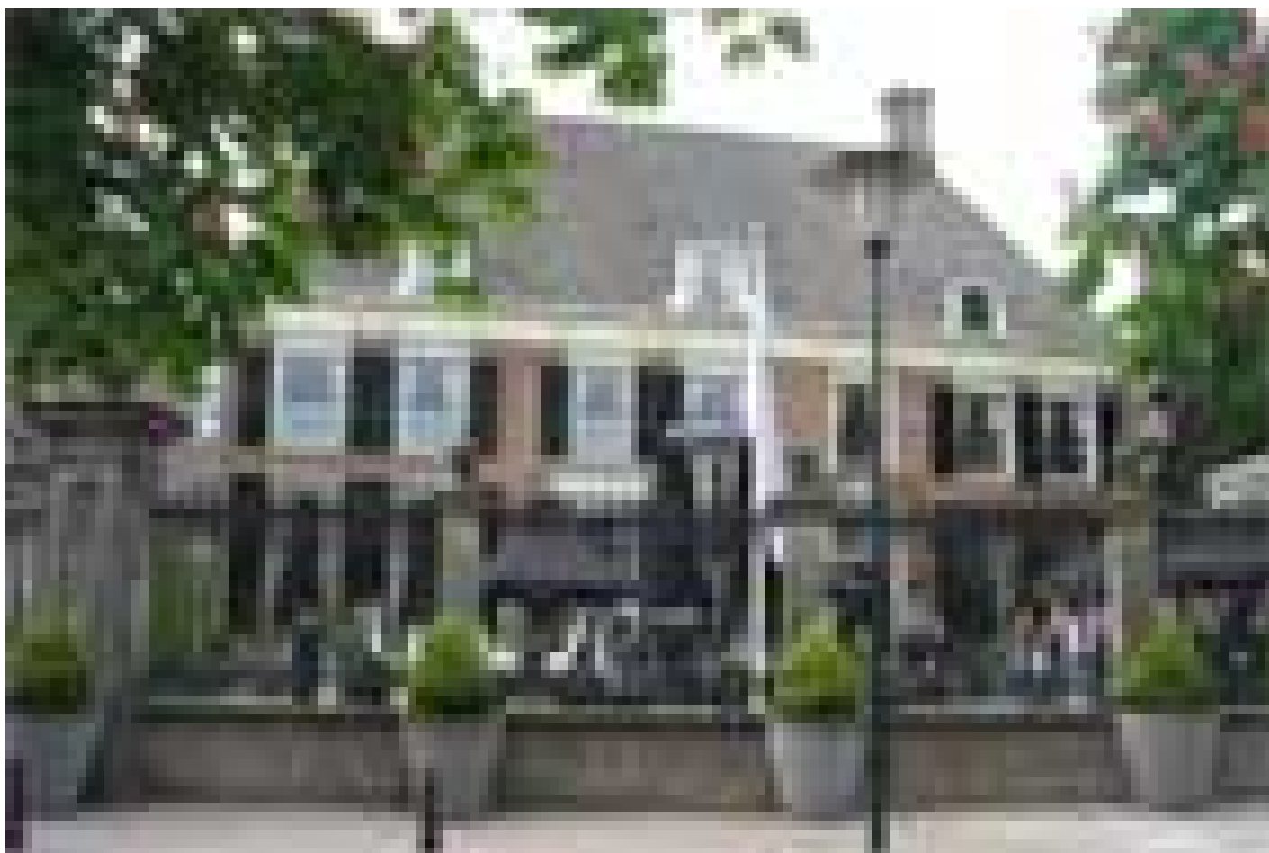
Hampshire Hotel - 's Gravenhof Zutphen **** (Zutphen)